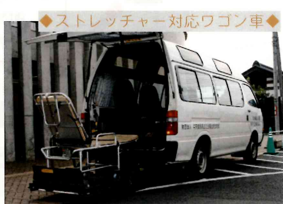
◆ストレッチャー対応ワゴン車◆