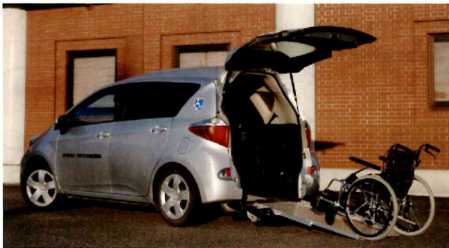
◆車いす対応自動車◆