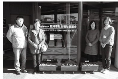
那珂市障がい児者親の会様からプリンターを寄贈いただきました。

那珂市社協は、所得税額から一定の金額を控除できる税額控除対象法人です。社会福祉協議会に寄付された個人のかたは、税制上の優遇措置が受けられます。