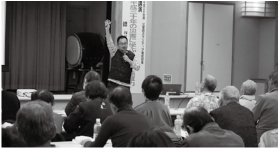
災害時ボランティア研修会の様子

いつ発生するかわからない大規模災害に備えるため「災害時ボランティア」を養成しています。災害の特性や災害ボランティアセンターの役割について学ぶことで、災害時のボランティア活動推進の役割を担います。