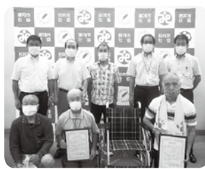
那珂市スワンの会様から 車いすを寄贈いただきました。

みなさまからお預かりしたあたたかいお気持ち(お金や物品)を 社会福祉のために活用させていただくための窓口です。