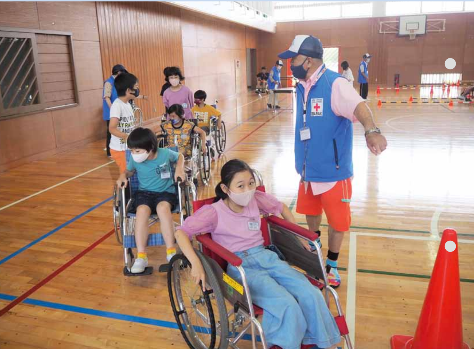
「菅谷東小車いす体験の様子」 詳しくは8ページをご覧ください