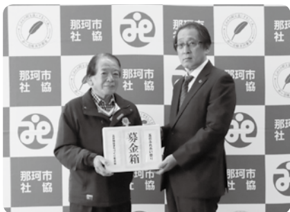
五台地区まちづくり委員会様から寄付をいただきました。

那珂市社協は、所得税額から一定の金額を控除できる税額控除対象法人です。社会福祉協議会に寄付された個人のかたは、税制上の優遇措置が受けられます。