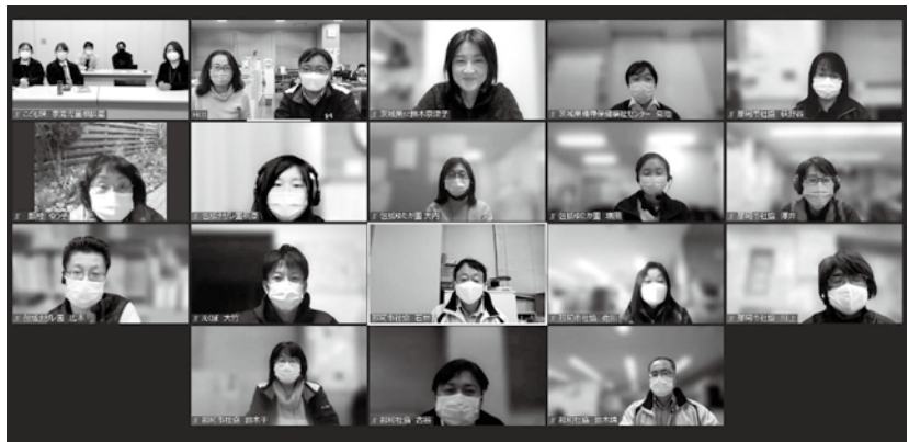
1月のひまわりカフェのようす

今後、新型コロナウイルス感染症の規制が緩和され、また皆で顔を合わせるようになり、お茶を飲みながら、勉強会、交流会ができる日を心待ちにしています。