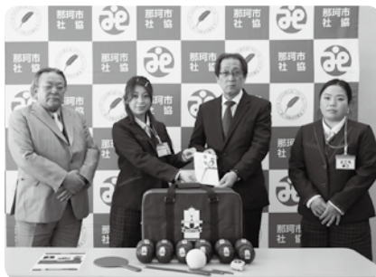
水戸ヤクルト販売株式会社様から福祉ヤクルトの一環でポツチャのセットの寄付をいただきました。